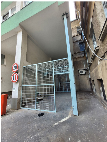
Obrázok č. 3: Priestor na vychádzky v exteriéri (KR PZ v Košiciach).

zaistení 24 alebo viac hodín by sa každý deň mala aspoň na jednu hodinu umožniť vychádzka v otvorenom priestore primeranej veľkosti a s potrebným vybavením (napr. prístreškom pre prípad nepriaznivého počasia a možnosťou relaxácie). 9 V prípade, že technické možnosti zariadenia neumožňujú vyčleniť na vychádzky adekvátny otvorený priestor, je potrebné zabezpečiť vychádzky v exteriéri inak, napr. formou vybudovania provizórneho prístrešku. Obdobným spôsobom situáciu vyriešili aj na Krajskom riaditeľstve Policajného zboru v Košiciach (pozri obrázok č. 3).