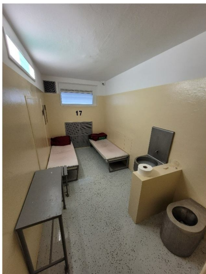
Obrázok č. 1: Neobsadená cela policajného zaistenia s fixne zabudovaným oknom bez možnosti jeho otvorenia.

Oddelenie KR PZ BA má aktuálnu kapacitu 19 ciel. Cely, ktoré sme navštívili, boli vybavené dvoma lôžkami, stolom a stoličkou napevno pripevnenými k podlahe, ventiláciou, svetelnou jednotkou, oknom, umývadlom, WC a kamerovým systémom. Priestory oddelenia prešli čiastočnou rekonštrukciou, ktorá sa skončila na prelome októbra a novembra 2023.