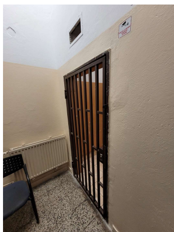
Predsieň pred určeným priestorom

Riaditeľ OR PZ BA I uviedol, že do určeného priestoru umiestňujú výnimočne pokiaľ ide o problémovú osobu, ktorá by mohla ohrozovať bezpečnosť príslušníkov alebo samú seba. Pokiaľ ide o pokojnú osobu, táto čaká za dozoru príslušníka kým nie sú vykonané všetky potrebné úkony (tieto osoby sú medzičasom umiestnené napr. v zasadačke alebo na chodbe).