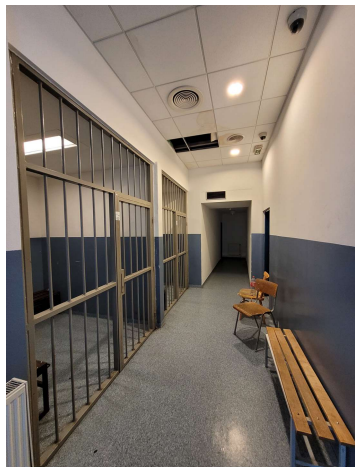
Určené priestory vedľa seba

OO PZ Staré mesto - západ disponuje dvomi určenými priestormi, ktoré sú situované na samostatnej chodbe a od zvyšného priestoru sú oddelené mrežami. V oboch priestoroch predstavuje zdroj sveta umelé osvetlenie na strope. Denné svetlo prúdi do priestoru len mierne z vedľajšej chodby, na oknách vo vedľajšej chodbe sú pri tom hrubšie závesy, ktoré denné svetlo podstatne tlmia. Priestory nemajú prirodzené vetranie, výmena vzduchu je zabezpečená len prostredníctvom ventilačnej jednotky, umiestnenej na strope chodby. Na obvode stien sú pripevnené dva radiátory. V čase návštevy bola teplota v priestoroch primeraná.