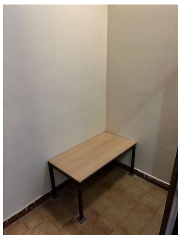
Určený priestor č. 3

OO PZ Trenčín disponuje tromi určenými priestormi, ktoré sú umiestnené pod schodiskom, respektíve v priestoroch schodiska. Všetky tri priestory pôsobia veľmi stiesnene, obzvlášť „určený priestor č. 2“, do ktorého neprúdi žiadne denné svetlo a po zavretí dverí je v ňom bez umelého osvetlenia úplná tma. Tento priestor nemá prirodzené vetranie, výmena vzduchu je zabezpečená prostredníctvom ventilačnej jednotky, ktorá je pomerne hlučná. Pre osoby s citlivosťou na hluk preto môže byť pobyt v takomto priestore mimoriadne náročný.