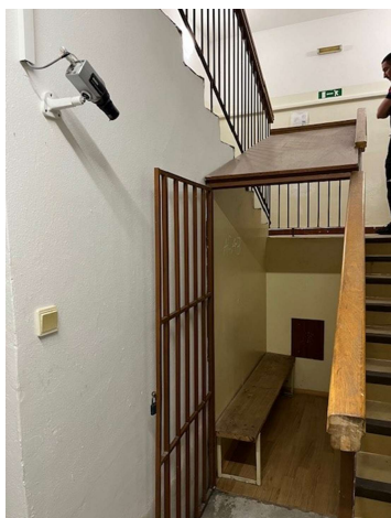
Určený priestor č. 1