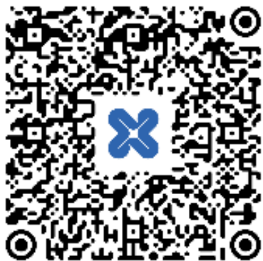
QR kód – Správa o činnosti komisárky pre osoby so zdravotným postihnutím za rok 2025

Podrobnejšie informácie o zisteniach NPM KOZP nájdete v Správe o činnosti komisárky pre osoby so zdravotným postihnutím za rok 2025, 56 ktorá je dostupná aj cez nižšie uvedený QR kód.